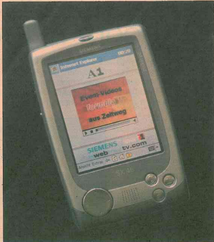
Bewegte Bilder am Handy werden Realität: Im Rahmen des Formel-1-Rennens am A1-Ring in Österreich demonstrierten mobilkom austria und Siemens, dass Video Streaming via GPRS mit hoher Qualität bereits realisierbar ist.